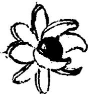
Exemples de croquis attendus

Recherches rapides de fleurs géométrisées :